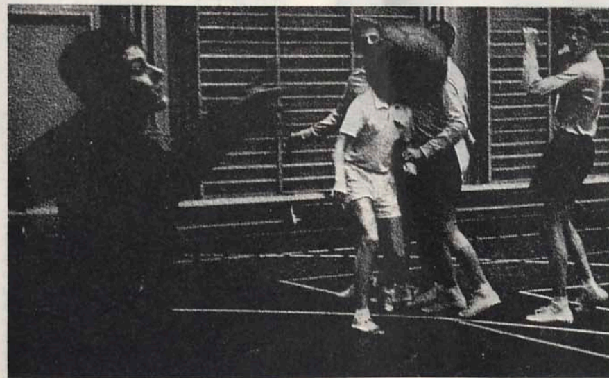
Gubbängens målvakt kastar sig efter bollen i DN:s handbollsturnering.

Hans Nygren-Bonnier Olle Englundh ordf. BLIF sekr.